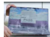
粉塵試験(筐体) ※写真の製品はK70ではありません。

※MIL規格に基づいて、一部当社が設定した試験条件に従って試験を実施予定です。 ※無破損、無故障を保證するものではありません。 ※これらのテストは信頼性データの収集のためであり、落下、衝撃、振動または使用環境の変化などに対する製品の耐久性をお約束するものではありません。また、これらに対する修理費用は、保証期間内でも有料になります。