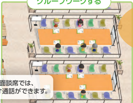
グループワークする