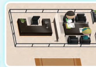
プライバシールーム