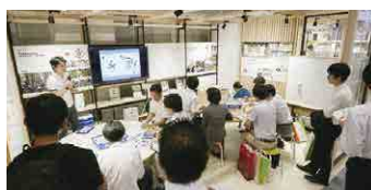
ミニセミナーの様子

教育現場で活用できる最新ソリューションを紹介するミニセミナーを開催いたします。 ぜひ会場でご体験ください!