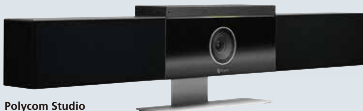
Polycom Studio PPUSB-STUDIO