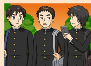
グループトークでいじめ