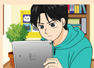
不適切な書き込み