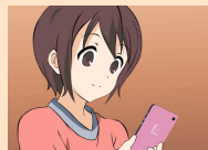
トークアプリ依存