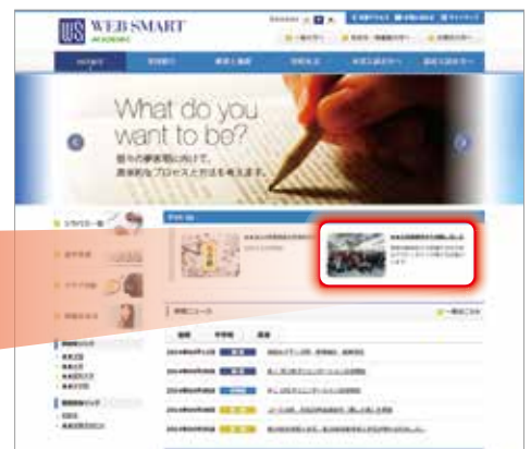
ホームページ表示画面