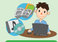
知っておきたい! 著作権のきまり