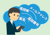
安全に利用するために