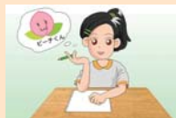
作った人の気持ち