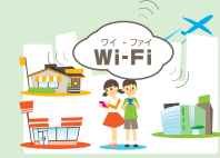
ネットと上手につきあうために