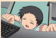
ルールやマナーを守る