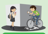
知っておきたい! 身近なきまり