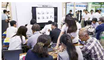
ミニセミナーの様子

教育現場で活用できる最新ソリューションを紹介するミニセミナーを開催いたします。ぜひ会場でご体験ください!