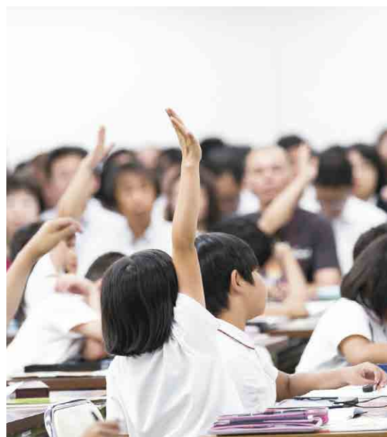
大阪教育大学附属池田小学校 6/16(土)