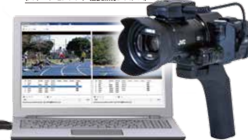
SS-WS1541 (スポーツセンシング社製無線システム)