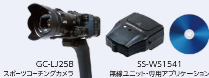
GC-LJ25B スポーツコーチングカメラ