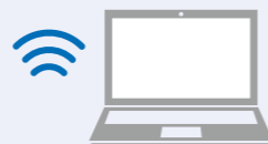
SS-WS1541 無線ユニット・専用アプリケーション