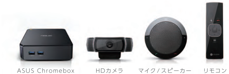
ASUS Chromebox HDカメラ マイク/スピーカー リモコン

インテル® Core™ i7-4600U プロセッサを搭載した ASUS Chromebox、1080PのHDカメラ、マイク/スピーカーユニット、使いやすいリモコン、必要なケーブル類、ソフトウェアがセットになっており、購入後すぐに高画質ビデオ会議が始められます。